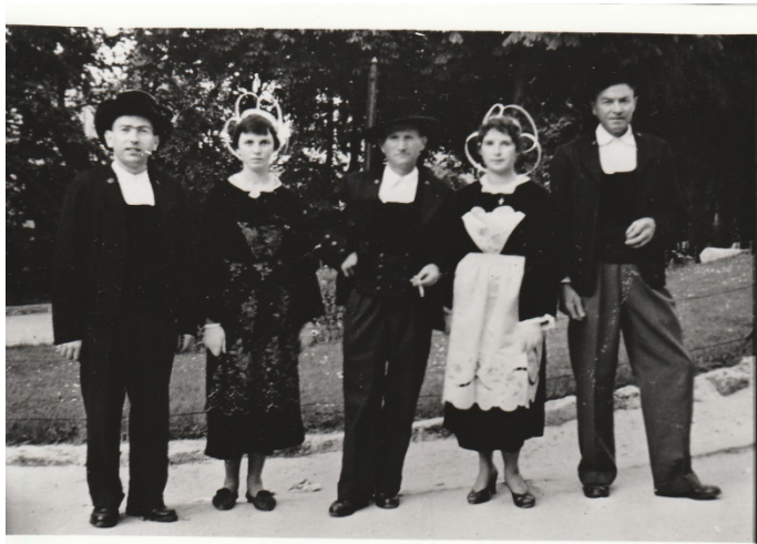
Kanerien ar C’hastell-Nevez, Issy les Moulineaux, 1958

Ha justamant, neuze, chañs m’eus bet d’aneo kanerien kan ha diskan ar C’hastell-Nevez. Ur wech (m’eus ket soñj met, m’eus ket soñj peogwir oan re vihan, daou vloaz hepken, met ma mamm n’eus kontet din) oan aet da Baris ga’ ma zad ha kanerien oa bet kaset ga’ ma zad da Baris evit ur fest-noz ba’ Paris, ba’r bloavezh eizh hag hanterkant. Ha pad an hent, hed an hent oa bet kanet ga’r ganerien. Ha me oa etrese ha ‘pad tout an hent d’hont deus ar C’hastell-Nevez bek Baris m’eus klevet kanañ ar-mod-se.