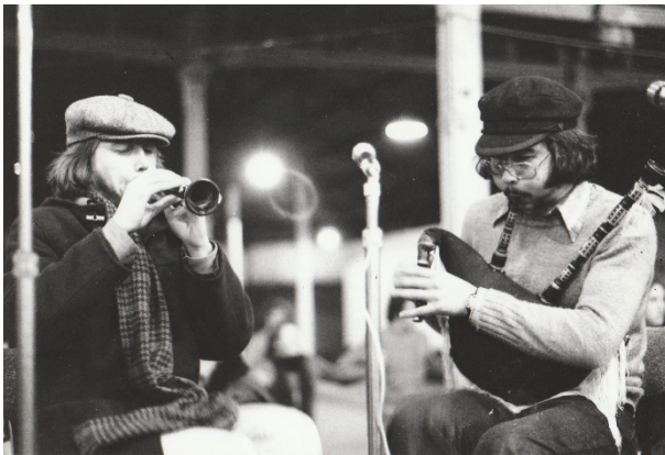
Le Meur-Toutous, Lisoù, Roazhon, 1975

Peseurt mod zo moaein bezañ soner en devezh a hirie ? N’eo ket normal, un dra souezhus, iskis eo, iskis-tre. Peseurt mod, en devezh a hirie, kavout daou soner ar-mod-se, unan gant ur vombard, unan all gant ur biniou ?