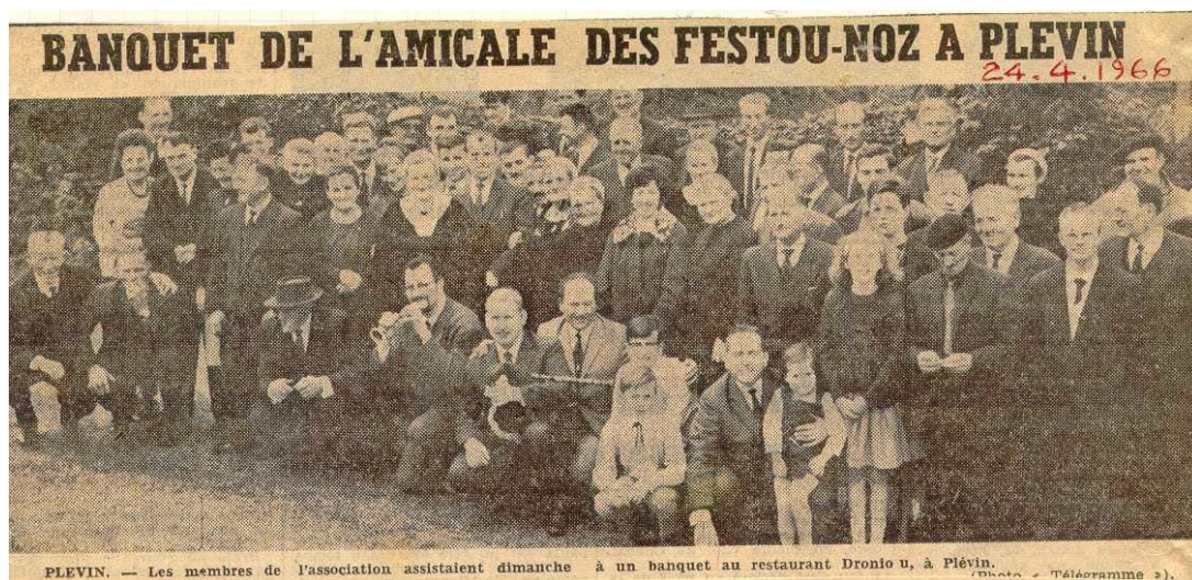
Emvod Amikal ar Meneiou Du, Plevin, 1966